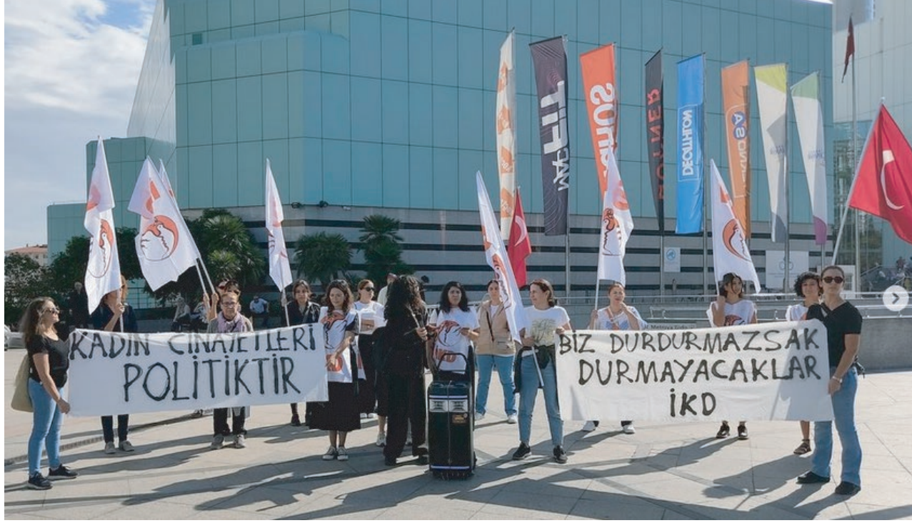
BİZ DURDURMAZSAK DURMAYACAKLAR