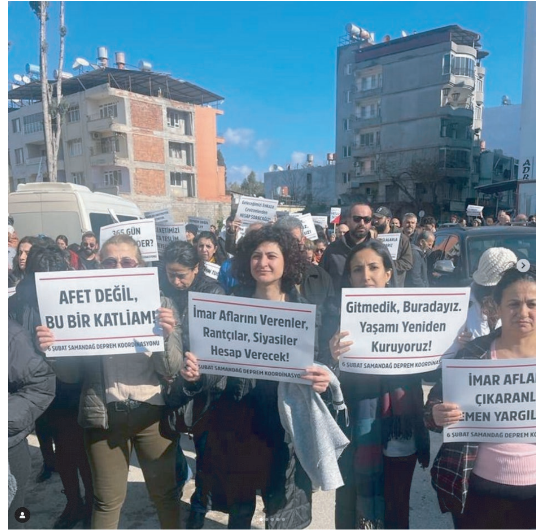
6 ŞUBAT DEPREMİ ANMASI / HATAY