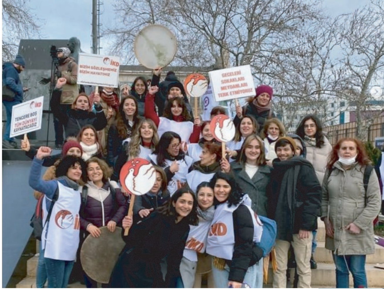
8 MART DÜNYA EMEKÇİ KADINLAR GÜNÜ