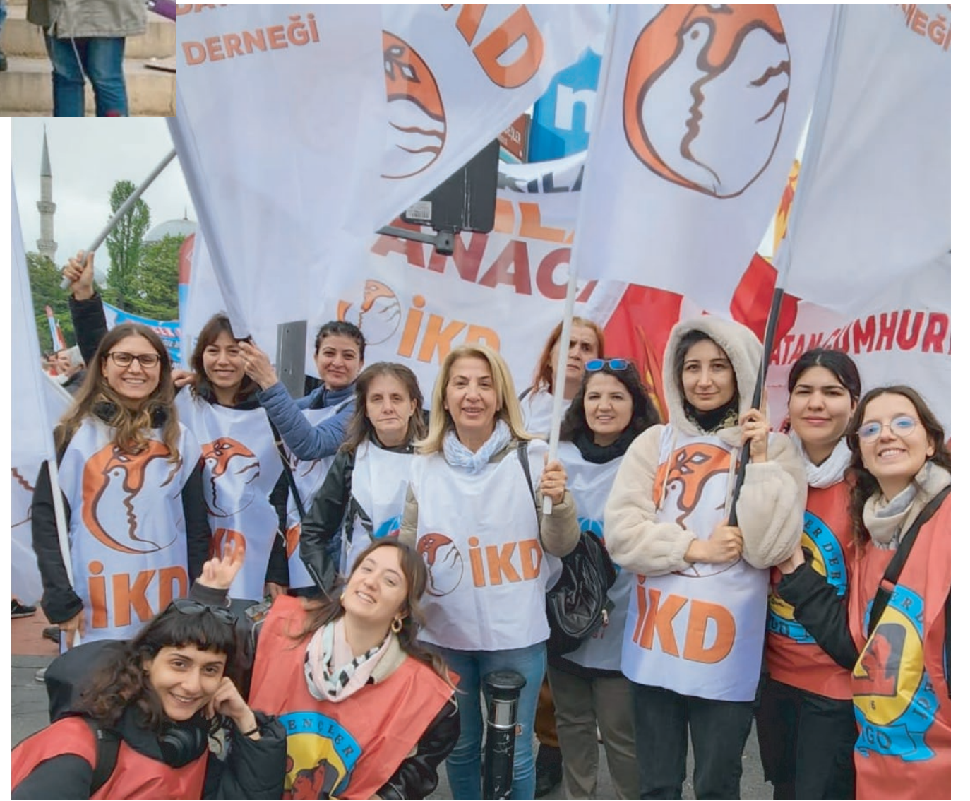
"LAİK EĞİTİM, İNSANCA YAŞAM, DEMOKRATİK TÜRKİYE" MİTİNGİ

KADINA KARŞI ŞİDDETEN ARINMIŞ BİR DÜNYA MÜMKÜN