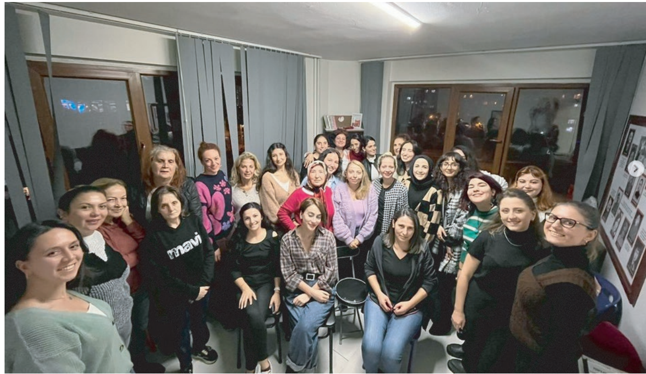
5 ARALIK DÜNYA KADIN HAKLARI GÜNÜ

KADINA KARŞI ŞİDDETEN ARINMIŞ BİR DÜNYA MÜMKÜN